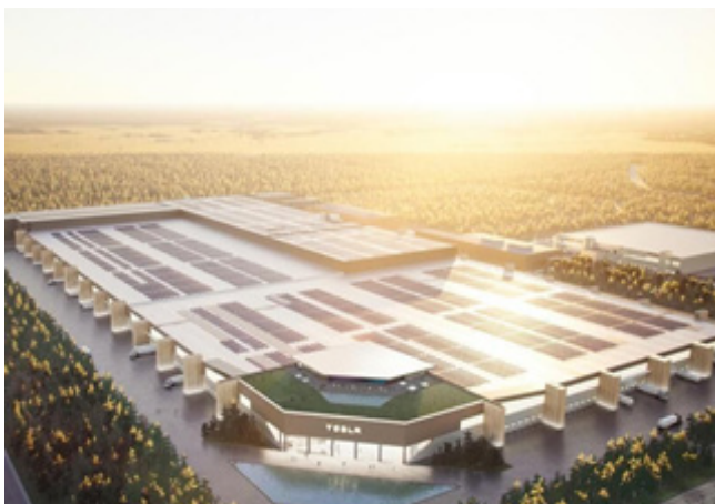
Die geplante Gigafactory von Tesla in Grünheide ist eins der vom BMVI geförderten Projekte.

Die EU-Kommission hat die Genehmigung für das Projekt EuBatIn (European Battery Innovation), das zweite europäische Großvorhaben zur Batteriezellfertigung, erteilt. Vom Bundesministerium für Wirtschaft und Energie (BMWi) werden Vorhaben von elf Unternehmen mit Sitz in Deutschland gefördert, darunter BMW, Northvolt und Tesla . Das BMWi macht keine Angaben zur Höhe der Fördersumme. Einem Bericht des Magazins „Business Insider“ zufolge wird Tesla mit einem einstelligen Milliardenbetrag gefördert.